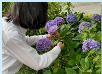
ボランティア部・広報委員